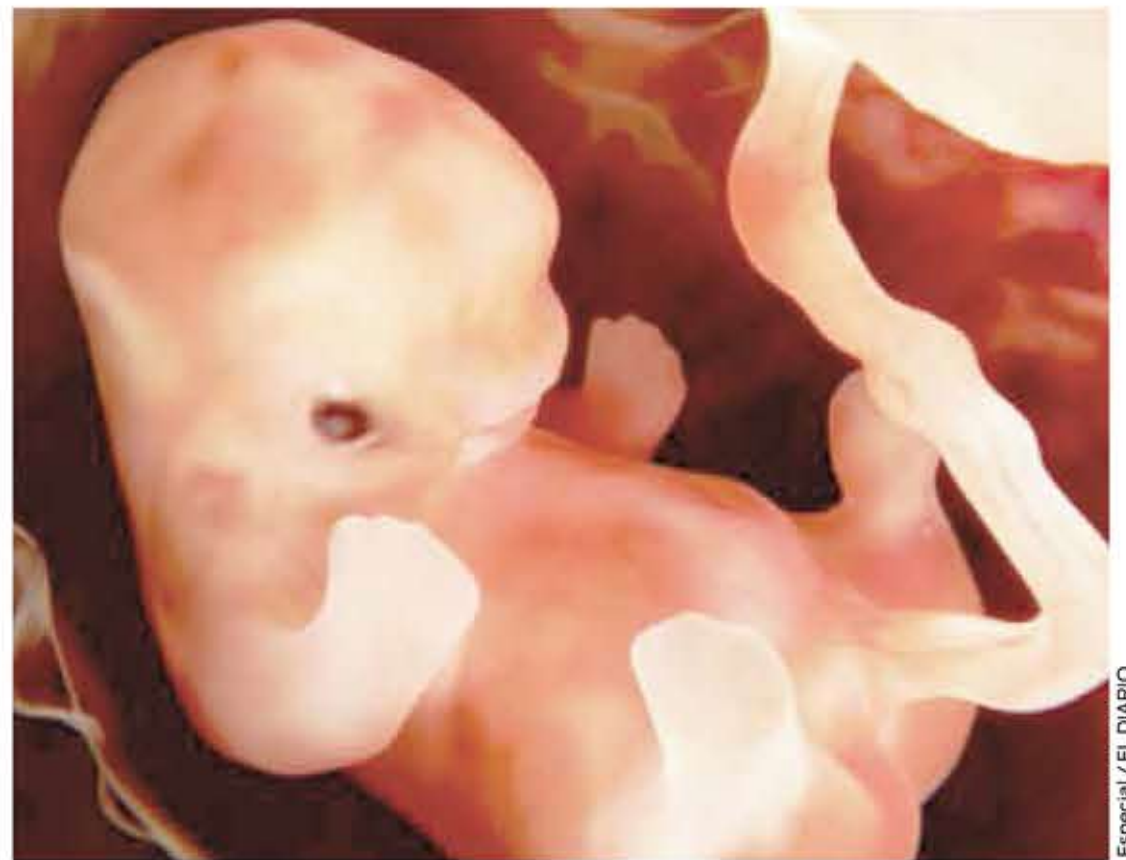
BUSCAN REALIZAR cambio de embriones

En Turija Serbia, hacen la Salchicha Más Grande del Mundo, la cual mide aproximadamente 2,025 metros (6,643 pies), y cada año rompen este récord Guinness siempre por un centímetro, para tener record para largo.