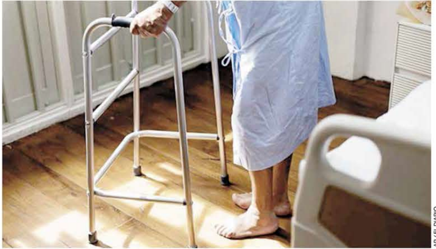
AUNQUE EL hombre aún no puede moverse ni hablar, ahora puede escuchar a su madre y sonreír en respuesta.

Estoy muy contenta. Espero que se recupere completamente. Nunca voy a renunciar a él. Espero que pueda volver a llamarme mamá algún día, dijo.