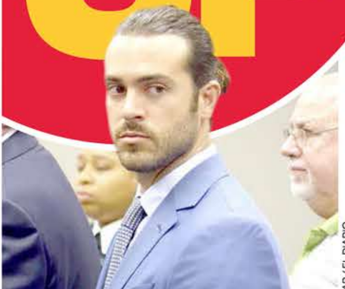
PABLO LYLE podría no sólo ir a la cárcel, sino también tendría que pagar una fuerte suma de dinero.