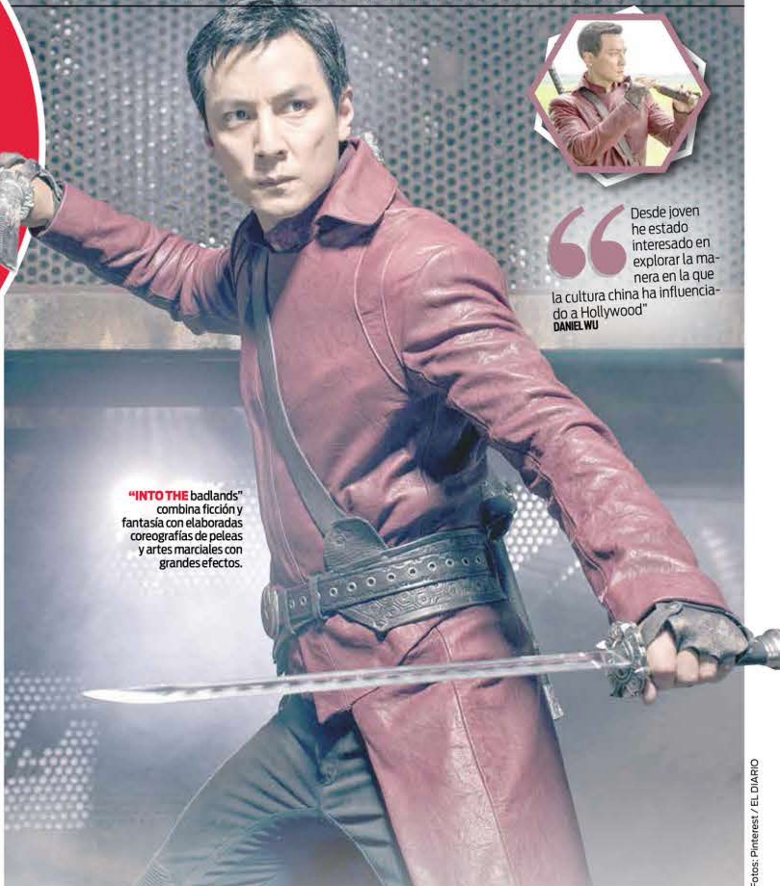
"INTO THE badlands" combina ficción y fantasía con elaboradas coreografías de peleas y artes marciales con grandes efectos.